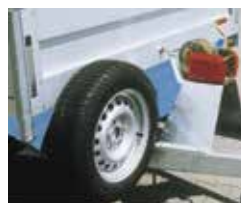
SP mit Zubehör Seilwinde 900 kg mit Windenbock, Ersatzrad vorne montiert.