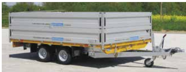
SP-Zubehör Aluminium-Aufsätze , 400 mm hoch, werkzeuglos steckbar. Rahmenteile orange farbeschichtet .