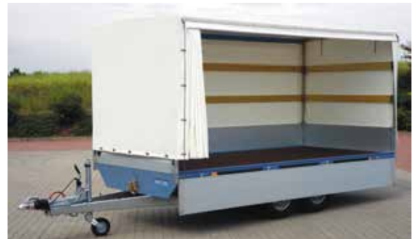
SP Zubehör PVC-Plane und Dachgestell aus verzinktem Vierkantrrohr geschraubt mit 100 mm Steigung. Besonders zu empfehlen ist, wenn das Dachgestell und die Plane als Schiebeplane ausgerüstet werden. Die Schiebeplane mit Leichtlaufrollen aus Metall lässt sich spielend leicht nach vorne ziehen, der Anhänger ist schnell zu öffnen. Bei normaler Plane lässt sich eine große Plane nur schwer nach oben werfen und der Wind weht sie leicht wieder herunter. Jede Höhe für Anhänger lieferbar, jedoch nicht mit einschiebbarer Plane (Kasackplane) und nicht mit Zollverschluss.