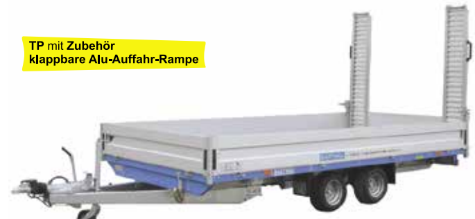
TP mit Zubehör klappbare Alu-Auffahr-Rampe

TP 3502 serienmäßig: Mit patentierter Außenrahmenladungssicherung TOPZURR® 21 rundherum. Eloxierte Aluminium-Bordwände, ringsum abklappbar und abnehmbar, Eckrungen steckbar, Ladehöhe 680 mm. Zubehör: Aluminium-Auffahrampen 2500 x 350 mm mit Rampenhalterungen unter dem Anhänger, Klappstützen, Bordwände seitlich in der Mitte mit steckbarer Mittelrunge geteilt (die Innenbreite ist im Bereich der Runge um 60 mm geringer, bei 6 m Serie, bei 5 m Aufpreis).