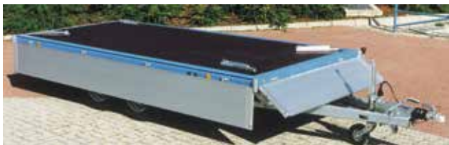
SP-Aluminium-Bordwände 400mm hoch, rundum abklappbar und abnehmbar, 4 steckbare Eckrungen und ein Plattformanhänger ist fertig.

Achtung! Es können keine Gurthaken TOPZURR® 21 verwendet werden. Es müssen Anbinderinge unter der Ladefläche oder versenkte Anbinderinge bestellt werden.