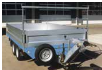
SP niedrig mit Bereifung 195/50R13C mit Zubehör: Höhenverstellbare Auflaufbremse mit DIN-Zugöse , wechselbar gegen Kugelkupplung, Ersatzrad vorne montiert wegen Klappstützen hinten, H-Galerie mit Holzeinlage.

Achtung! Es können keine Gurthaken TOPZURR® 21 verwendet werden. Es müssen Anbinderinge unter der Ladefläche oder versenkte Anbinderinge bestellt werden.