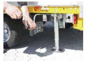
Aluminium-Auffahrampen, unter der Pritsche eingeschoben mit Klappstützen. (Bei kleinen Rädern 13 Zoll nur mit Klappkurbelstützen lieferbar - Mehrpreis, Abbild. rechts).