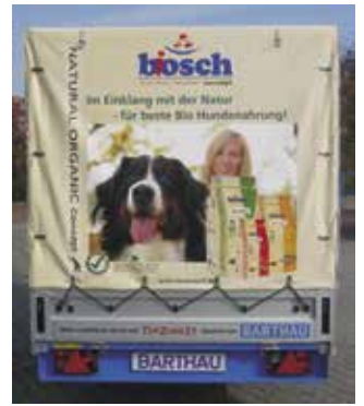
Werbebeschriftung im Digitaldruck Werbebotschaft ohne Grenzen. Auf einer weißen Plane werden Fotos und Schriften aufgedruckt.