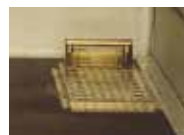
Typ SP mit Aluminiumrampen und mit Faltverdeckgestell , für Kranverladung geeignet, als Zubehör, dazu Bordwände mit Mittelrungen .