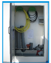
Raumeinteilung bei 3m Länge