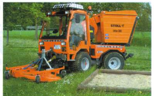
Aufbausauger der Edition 3000 auf dem Holder Kommunal-schlepper C358.

mit Boden- oder Hochentleerung lieferbar. Ein Kippen ist selbst beim An- und Abbau nicht zu befürchten, dafür sorgt auch die beidseitig geführte Hebe-technik. Trotz hoher Leistung arbeiten die Absaugergeräte angenehm leise. Die patentgeschützten Turbinen arbeiten auf so genannter Schwungradbasis. Diese gewährleistet eine hohe Saugleistung bei geringer Antriebsleistung. Infos unter www.stoll-landchaftspflege.de