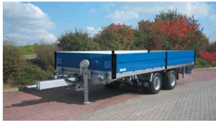
Typ LH18000 serienmäßig mit Zwillingsbereifung . Mit Zubehör Sonderlackierung und Schiebestützen .