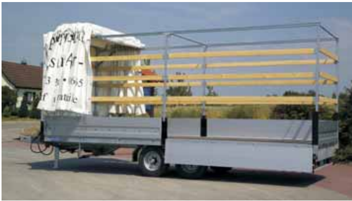
Typ LH mit Zubehör Faltverdeckgestell für schnelle Kranbeladung. Dach und Plane schieben sich vorne zu einem Paket zusammen.