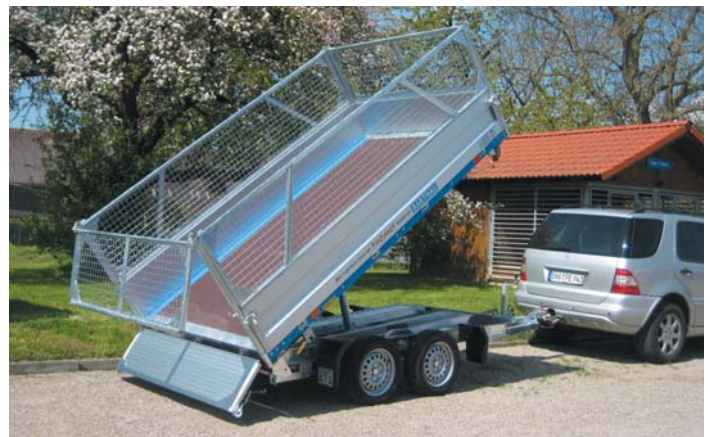
DK 2702 mit Zubehör: Laubgitter feuerverzinkt, 600 mm hoch, werkzeuglos steckbar, 3seitig zum Pendeln.