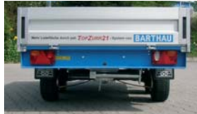
Zubehör: 1 Stk. Klappkurbelstütze (Bei RT/RH kann nur eine Stütze in der Mitte montiert werden.)