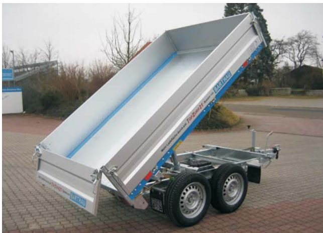
Typ DK hintere Klappe serienmäßig mit Pendelbordwand und mit Zentralverriegelung. (Betätigung mit einem Hebel von der Seite.) Mit Zubehör: Bodenschutzbelag aus 1,5 mm verzinktem Stahlblech auf dem Multiplexboden aufgelegt, keine Durchbiegung.