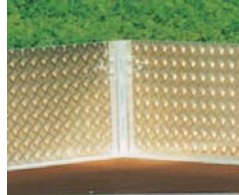
Zubehör: Schutzbelag aus 4 mm Alu-Riffelblech auf den Bordwandinnenseiten.