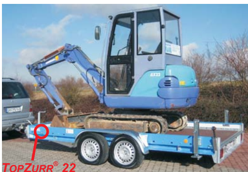
siehe Infobroschüre Nr. 8