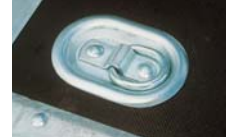
Zubehör: Im Boden versenkte Anbinde- ringe (nur DK).