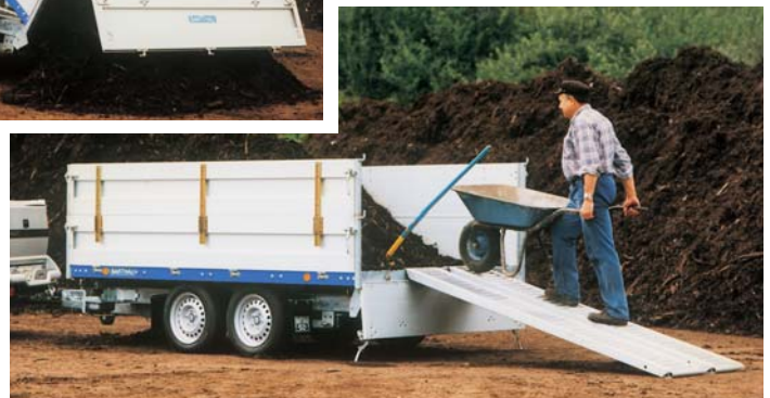
DK 2702 mit Zubehör: Alu-Auffharrampen mit Halterung unter der Ladefläche und 2 Klappstützen, Aluminium-Aufsätze 400 mm hoch, werkzeuglos steckbar, heckseitig Pendelbordwand.