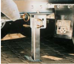
Klappstützen mit Federriegelsicherung (nur DK)

Zubehörkombination Handpumpe, Elektropumpe und Zusatzbatterie: Elektropumpe 12 oder 24 Volt zusätzlich mit Batterie in einer Kunststoffstaubox. Zur Elektropumpe gehört serienmäßig eine Fernbedienung mit Kabel. In die Zuleitung wird eine Handpumpe eingebaut, die bei Bedarf eingesetzt werden kann. Z.B. kein Strom mehr in der Batterie und kein Zugfahrzeug mit passender Steckdose. Es muss bei der Umschaltung von Batterie- in Handbetrieb nichts umgestellt oder beachtet werden.