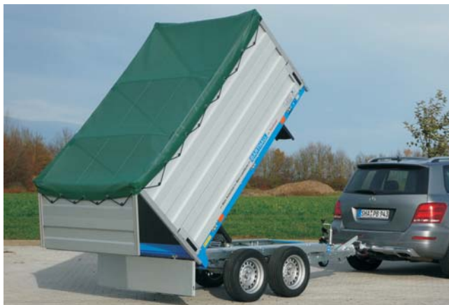
RH 2002 mit Zubehör: Laubaufsatz 700 mm hoch aus Aluminiumprofil an einem Stück gefertigt und hinten mit Pendelbordwand , Flachplane aus luftdurchlässigem Netzgewebe und Stützbügel für Flachplane.