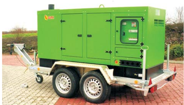
siehe Infobroschüre Nr. 3.2