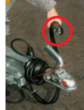
Zubehör: 2 poliger Stecker für Elektropumpe.