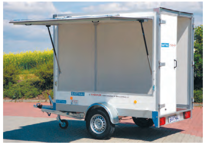
CT 1801 mit Sonderwunsch: Verkaufsklappe links mit großen stabilen Gasfedern und Feststeller, Brüstung 500mm hoch. Serienmäßig von innen verriegelt oder gegen Mehrpreis mit Drehstangenverschluß von außen abschliessbar.