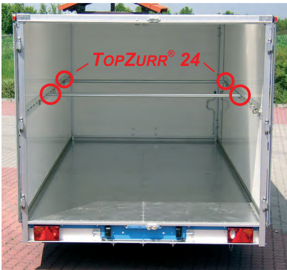
CH 2702 mit Zubehör: Sonderhöhe von 1850 mm Innenhöhe. Außerdem hat dieser Hochlader eine Sicherheitskupplung an der V-Deichsel montiert und Stoßdämpfer für ruhiges und sicheres Fahren. Als Tandemfahrzeug ist er serienmäßig mit einem schweren Stützrad ausgestattet.