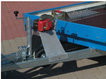
Zubehör: Seilwinde mit Windenbock und Verstellkeil auf Aluminium-Arretierblech.