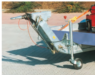
Zubehör: Höhenverstellbare Auflaufvorrichtung für Verwendung hinter LKW.