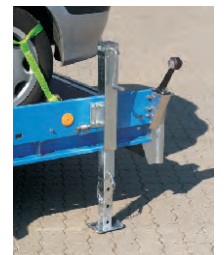
Zubehör: Teleskopstützen , mit Bolzen arretierbar, Feineinstellung mittels Kurbel, Tragkraft 1500 kg.