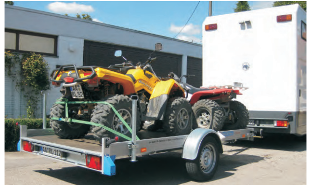
QM 1801 Quadtransport

» siehe Modellreihe WC in Infobroschüre Nr. 6!