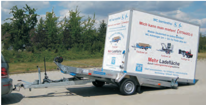
QM 1801 mit Hydraulikzylinder kippbar. Mit einer Seilwinde wird der Container WC 00 für den Transport hochgezogen und anschließend an den Vermietungsort gebracht.